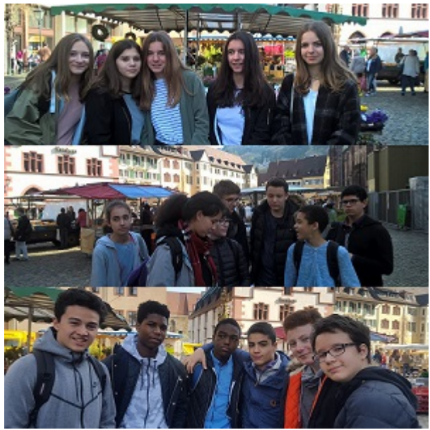
Mardi 28 mars : visite du parlement européen, toujours en compagnie du beau temps.